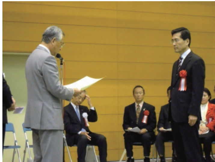
かわごえ産業フェスタ開会式（11月15日〔土〕）にて、認定・表彰式の模様

川越市と川越商工会議所では、市内の中小企業が開発した、優れた工業製品・技術を「川越ものづくりブランド KOEDO E-PRO」として認定し、市内外に広く情報発信することで、市内の工業振興を図ることを目的とした認定制度です。